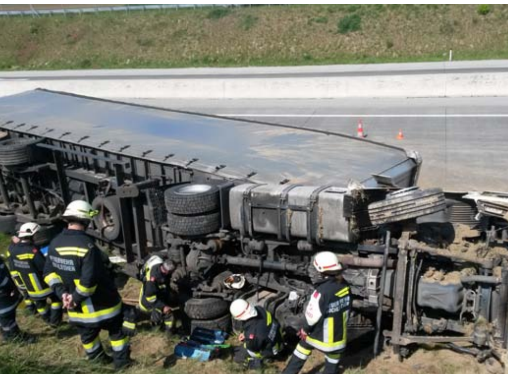
Schwerer LKW-UNFALL (BERICHT SEITE 5)

INHALT: EINSÄTZE, WEITERBILDUNGEN, FLORIANIFEIER NÄCHSTE TERMINE: 08.08 + 09.08 ZELTFEST 25.08.2015 BLUTSPENDEN