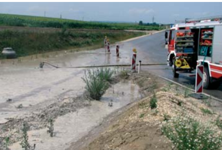
RLF beim umpumpen des Wassers

HOCHLEITHEN / B7 - Ein starkes Gewitter setzte Straßen unter Wasser | 06.07.2009 – 13:58 |