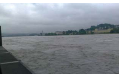
Kleinlöschfahrzeug mit dem Sonderpumpenanhängler im Einsatzgebiet