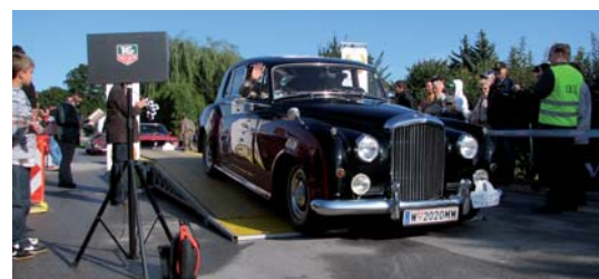
45 Fahrzeuge nahmen an der Rallye teil.