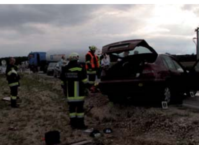
Für die Bergung des Sattelzuges kam uns der Kran der Feuerwehr Mistelbach zur Hilfe.

Eingesetzte Fahrzeuge: RLF-A, TLF-A, VRFA, KLF, KDOF, Abschleppachse