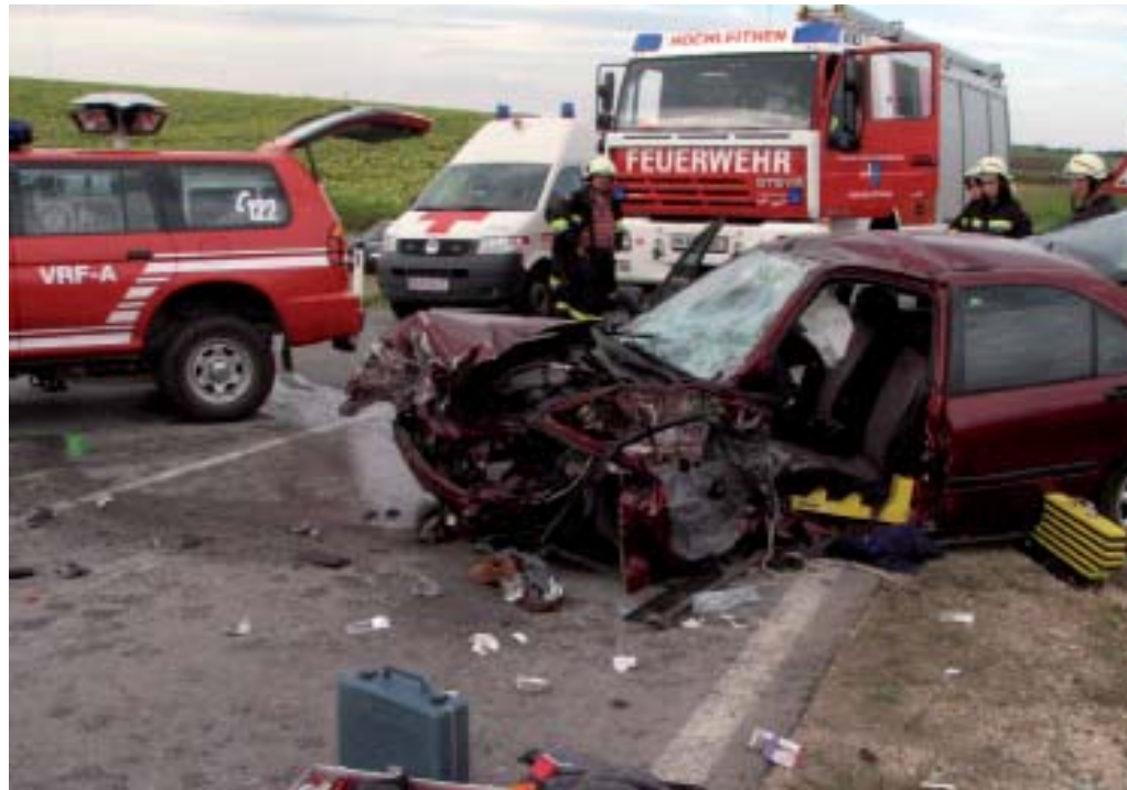
Die Landesstraße B7 war für mehrer Studen gesperrt. Bericht siehe Seite ZWEI

Aus ungeklärter Ursache verlor ein PKW Fahrer beim Kasanwirt auf der Landesstraße B7 die Kontrolle über sein Fahrzeug und kollidierte mit einem entgegenkommenden Tanksattelzug.