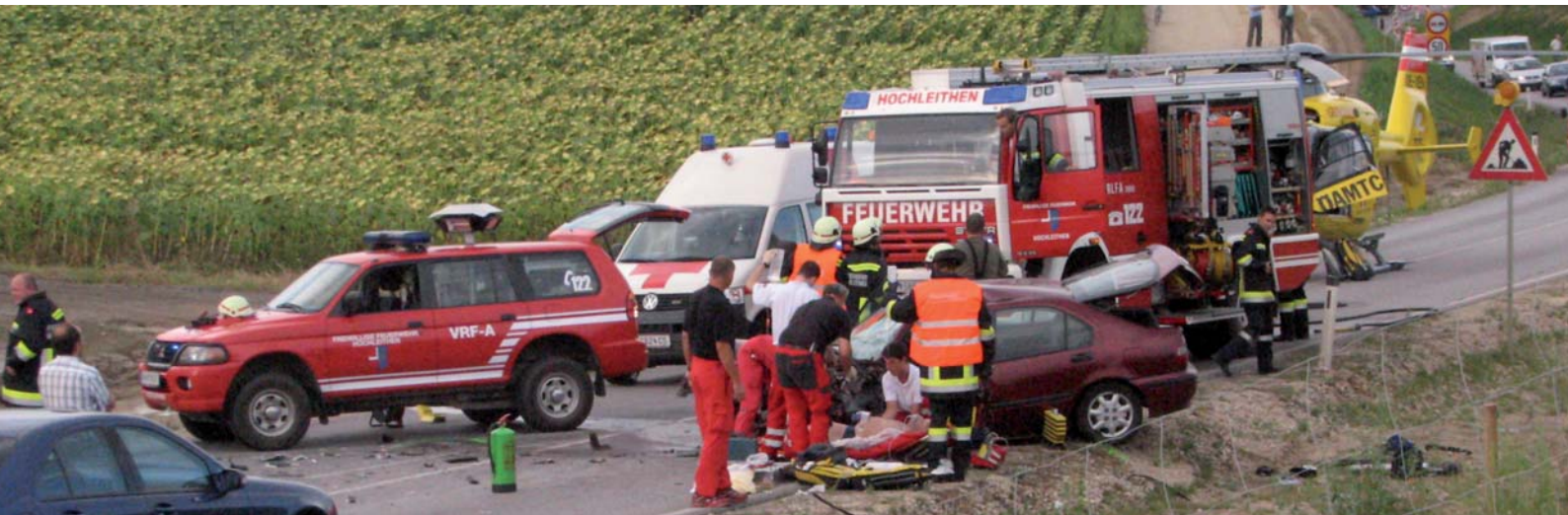
Gemeinsam mit den Rettungskräften wurde der schwer verletzte Fahrer versorgt.

HOCHLEITHEN / B7 - Frontalzusammenstoß zwischen PKW und LKW | 13.08.2009 – 17:23 |