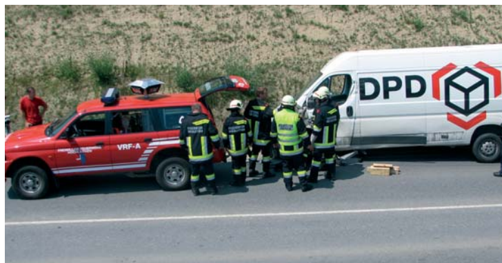
Unfallfahrzeug bei der Vorbereitung zum Abtransport