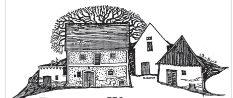
REGNER - WEINVIERTEL

PDS - Reinigung und Dienstleistungen GmbH