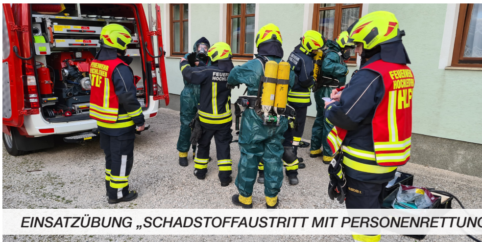
EINSATZÜBUNG „SCHADSTOFFAUSTRITT MIT PERSONENRETTUNG“ - 28.04./04.05.2022

Von derartigen Übungen profitieren nicht nur unsere jungen Mitglieder, sondern auch erfahrene Kameraden können dabei ihr Wissen immer wieder auffrischen.