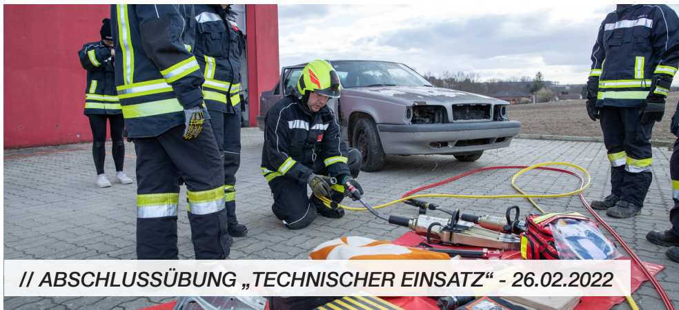
// ABSCHLUSSÜBUNG „TECHNISCHER EINSATZ“ - 26.02.2022