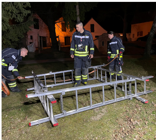
// FUNK- & SCHADSTOFFÜBUNG - 25.03.2022

rekten Arbeitsweise mit unserem hydraulischen Rettungsgerät im Ernstfall. Danke für euer Engagement und die gute Unterweisung in dieses wichtige Thema!