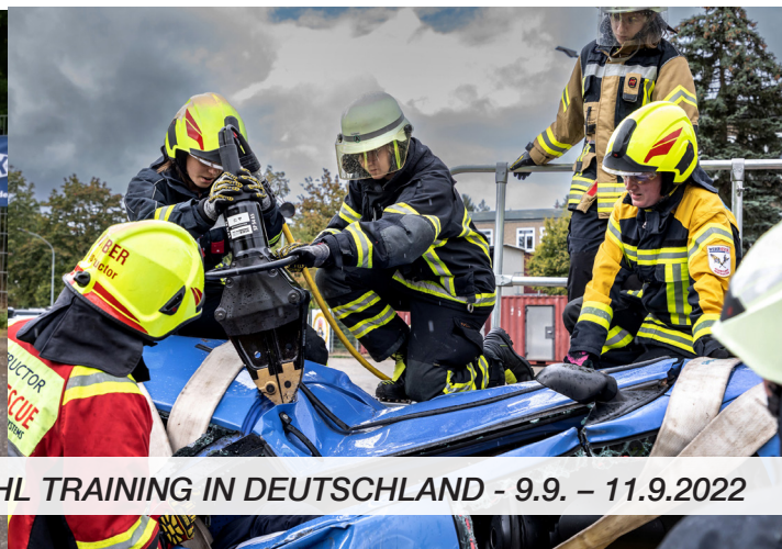
// THL TRAINING IN DEUTSCHLAND - 9.9. - 11.9.2022