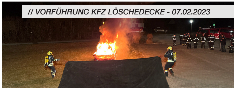
// VORFÜHRUNG KFZ LÖSCHEDECKE - 07.02.2023