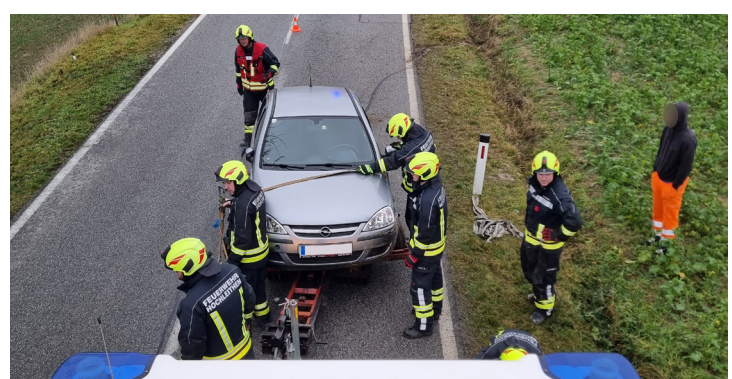
// PKW BERGUNG IN TRAUNFELD - 10.12.2022